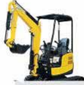
Mini Paletli Ekskavatör